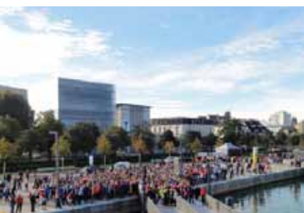
Feuer Hafen Bregenz