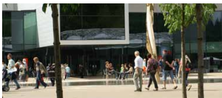
Bild links