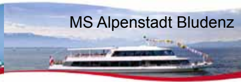
MS Alpenstadt Bludenz