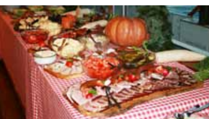
Herbstkreuzfahrt - Eine der beliebten Herbstkreuzfahrten