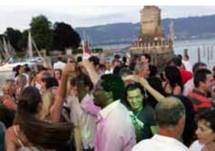
Tropical Boat - Eine der zahlreichen Tanzfahrten