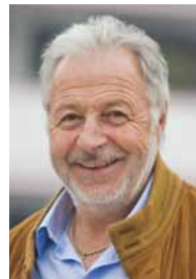
Werner Reinstadler Bus- und Reisegruppen