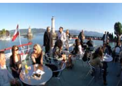
Einiges von vielen Events auf dem Schiff