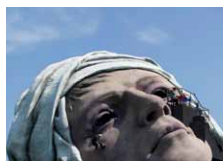
Bild rechts: Bühnenbild Bregenzer Festspiele