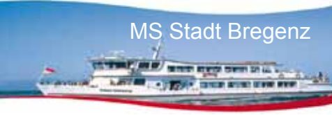
MS Stadt Bregenz