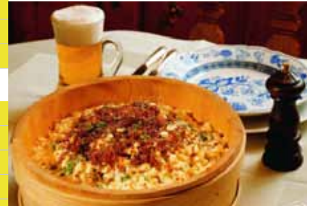
Kässpätzlepartie oder besser: Käsknöpflepartie