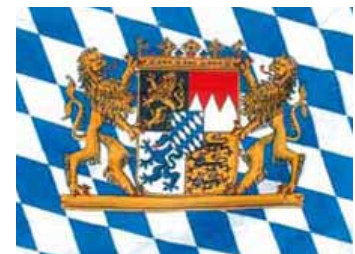
Oktoberfest-Stimmung auf dem Schiff