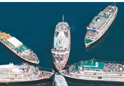
Stettener Sternfahrt - Offizieller Saisonbeginn